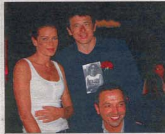
La princesse Stéphanie, Patrick Bruel et Kamel Ouali, pendant le dîner.

Retrouvez les photos du concert sur www.monaco.majprincipaute.com