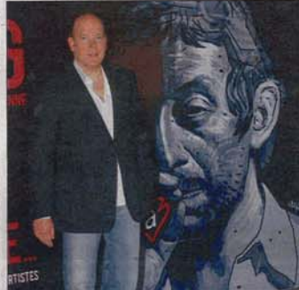
Tenue décontractée : jeans, chemise ouverte et tennis pour Albert II, sous l'œil de Gainsbourg.