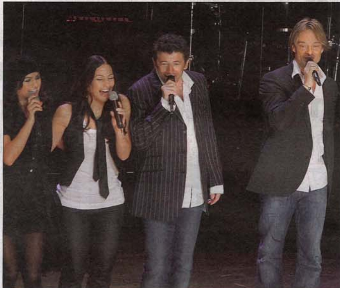
Patrick Bruel et David Hallyday sur scène pour un concert contre le sida et un hommage à Gainsbourg, hier sur la scène du Grimaldi Forum.

Un peu plus tard Agnès Jaoui et David Hallyday se