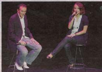
Moment intime entre Alizée et Elie Semoun pour une reprise bossa des « Petits Riens ».