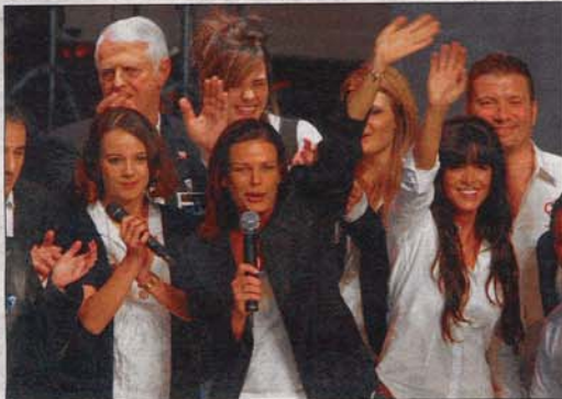
Réunis sur scène autour de la princesse Stéphanie, les artistes (ici Elie Semoun, Alizée et Jenifer) ont joué le jeu de reprendre les mélodies de Gainsbourg.

« Ouvrez vos yeux, vos oreilles et votre cœur » priait la princesse Stéphanie, jeudi soir au public venu assister au gala « Gainsbourg, je suis venu te dire », auquel assistait le souverain. Un spectacle-voyage à travers la carrière du Grand Serge au profit de Fight Aids Monaco (voir Monaco-Matin d'hier). Après le spectacle, une ambiance « Saint-Germain-des-Prés » attendait les convives. Dès l'entrée, les comédiens de la compagnie Florestan incarnent en mots et en costumes les chansons de Gainsbourg. Son image, iconique occupant l'espace. Tout autour, pour accompagner le dîner, le Paris rive gauche. Des images du Café de Flore, un accor-