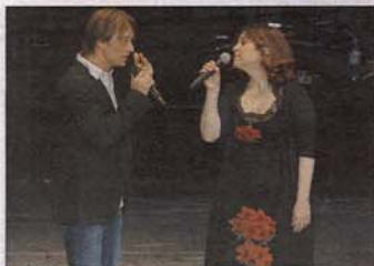
« Comme un boomerang », improbable duo entre Agnès Jaoui et David Hallyday.