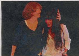
Complicité tendre entre les deux marraines du spectacle Jane Birkin et Jenifer.

déon qui joue quelques rengaines immortelles... et la reconstitution de la bouche de métro de Saint-Germain, ligne 4.