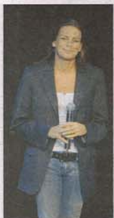
Jeans et blazer, sur scène, à la mode Gainsbourg pour la princesse Stéphanie.