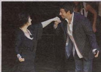
Maurane et Patrick Bruel, réunis comme souvent pour « L' Aquaboniste ».